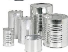
SCATOLETTE PER ALIMENTI