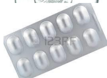
BLISTER FARMACI VUOTI